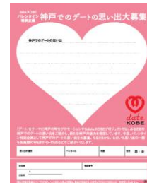
大好きな人と手をつなぐための手袋「GLOVERS」 共通のデートログ募集用紙